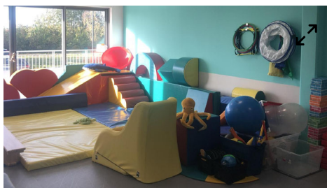
La vaste salle de psychomotricité donne sur une terrasse.

Le service, auquel on accède près du bureau des entrées, est bâti en cercle, avec un patio central de 300 m 2 et de grandes terrasses. « La première fois que je suis venue ici, devant la terrasse, et que j'ai vu les enfants goûter dehors et chahuter ensemble, j'ai pleuré », confie Séverine Fritot.