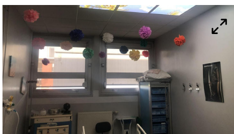
Dans la salle où des injections qui peuvent être douloureuses sont pratiquées, les soignants peuvent avoir recours à l'hypnose. Le décor lumineux au plafond invite à la détente.

La pièce réservée aux soins lourds, équipée pour la pratique de l'hypnose, est excentrée.